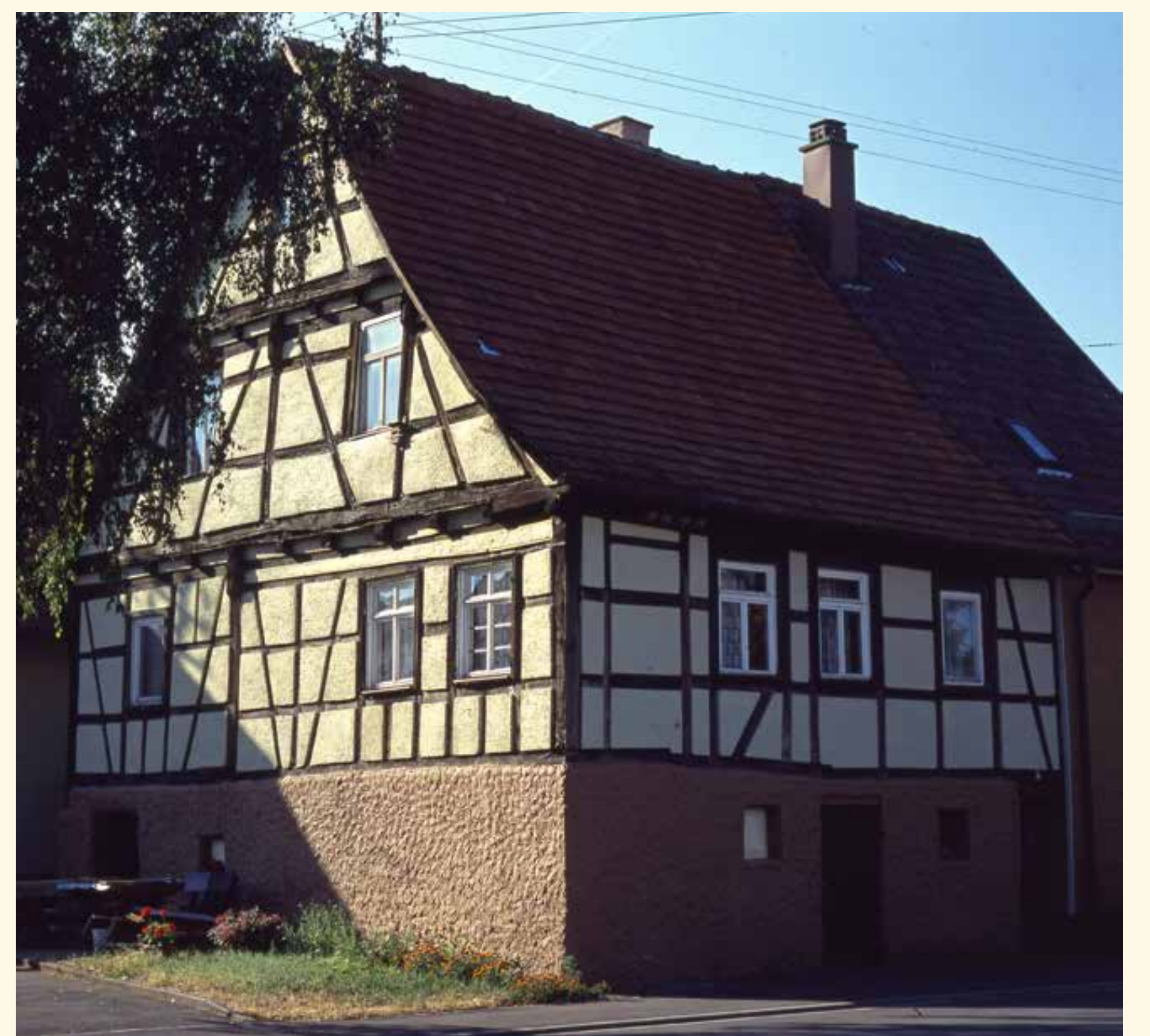
Haus Stäbler, Aufnahme 1970

Weitere Informationen der einzelnen Stationen finden Sie online – hierzu einfach den entsprechenden QR-Code scannen.